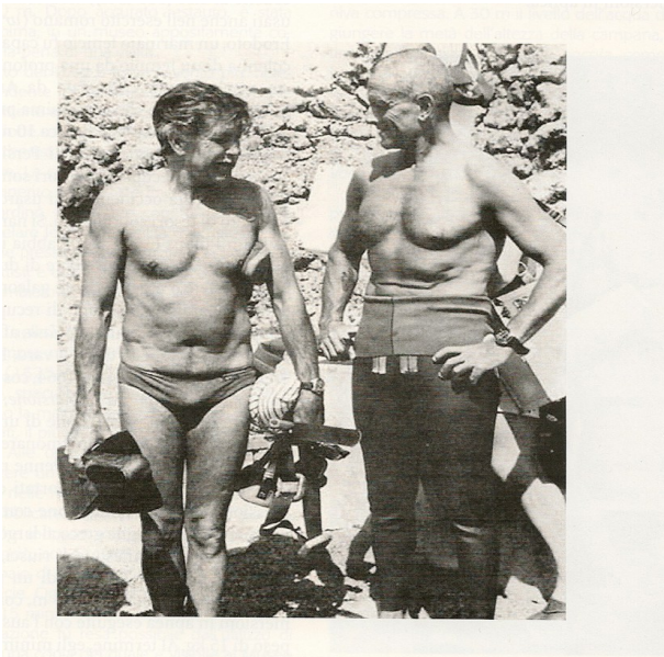
Jaques Mayol ed Enzo Maiorca, nel 1978.

Si passa quindi a due altri famosissimi apneisti, il francese Jaques Mayol ed il siracusano Enzo Maiorca, storici rivali per la conquista del record mondiali di immersione.