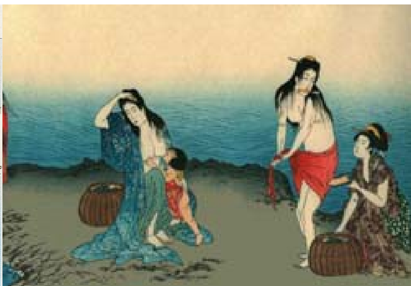
Le pescatrici di perle Ama