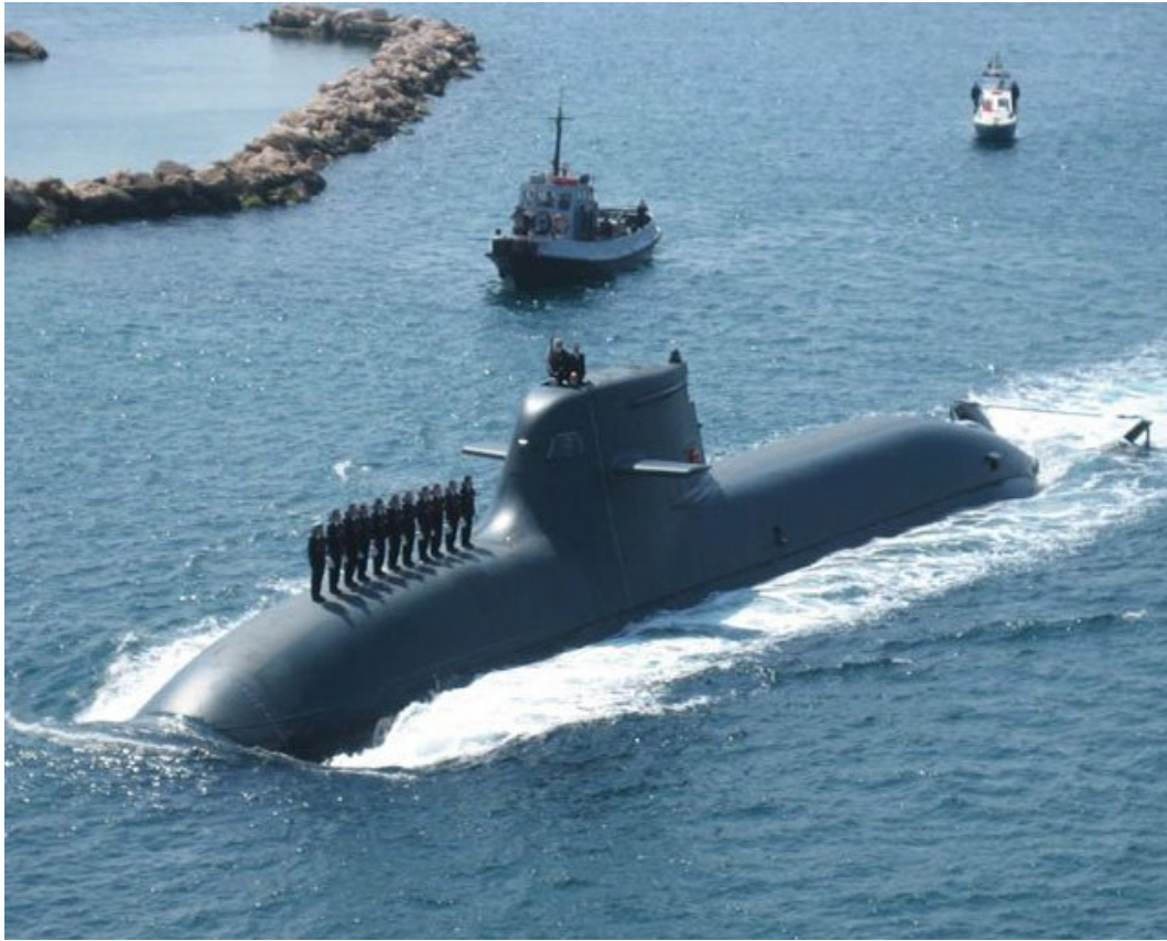
Sottomarino della classe Todaro