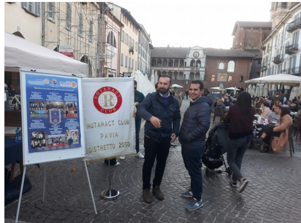
Il banchetto Rotary e Rotaract in Piazza della Vittoria