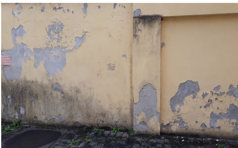
L'esterno della cascina Loghetto.

- Il 16 Ottobre ci si è recati alla Cascina Loghetto, un edificio utilizzato da ANFFAS, per esaminare i possibili mezzi di contenimento dell'umidità di risalita. Era presente anche un tecnico della ditta DomoDry, depositaria di un'innovativa tecnica di risanamento dei muri danneggiati dall'umidità.